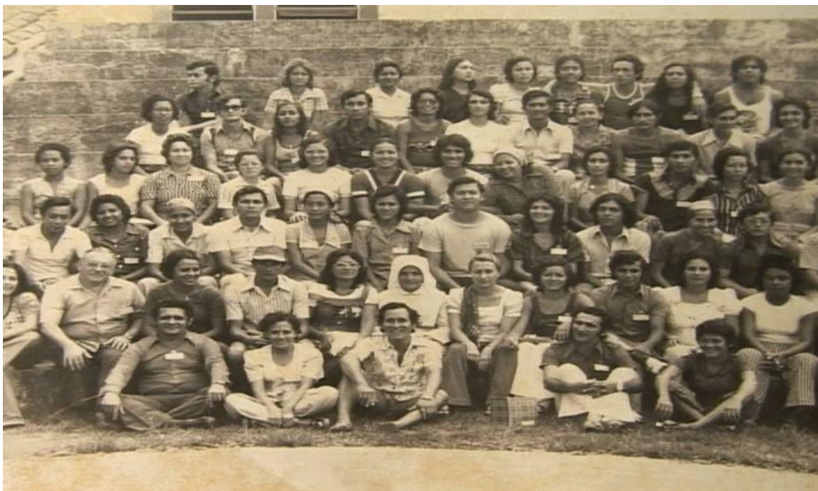
Formação inicial do T. L.C (Turma de líderes cristão).

O grupo T.L.C teve papel fundamental nos adornos da procissão de Corpus Christi .