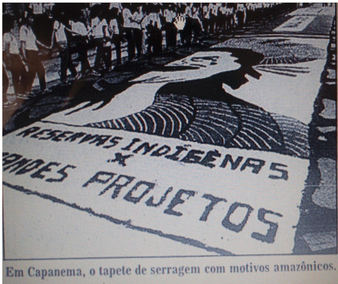
Figura 10- Temáticas indígenas penetram no Corpus Christi de 1989.

Outro fato notável do Corpus Christi de Capanema-PA são as reminiscências indígenas na procissão. Dentre tantos temas abordados ao longo destes 39 anos, a ecologia, a degradação do meio ambiente, temas pertencentes ao campo da vivência do entorno amazônico e do desmatamento, adquiriram um lugar de destaque no ano de 1989, quando foi posto em debate o tema "Ecologia" na decoração de um tapete disposto pelas ruas de Capanema.