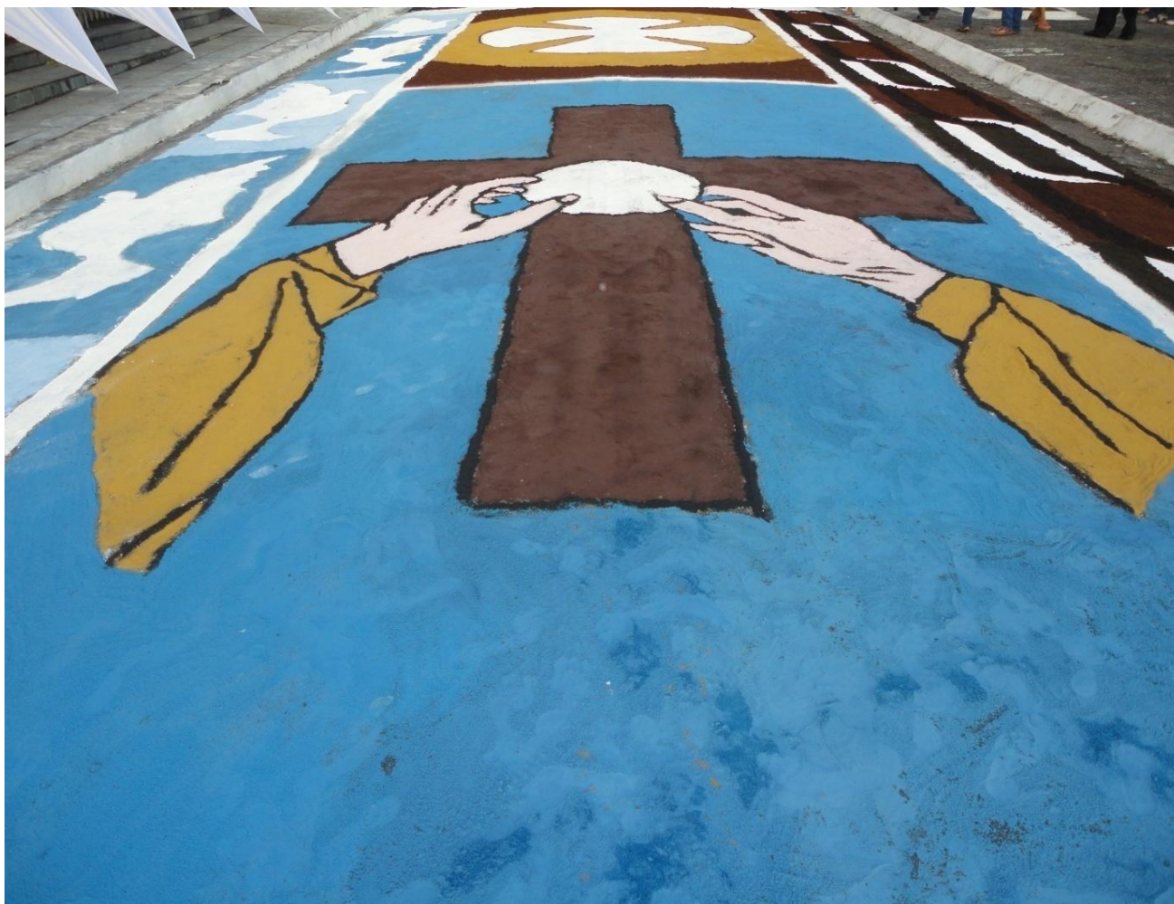
Figura 4 - A cruz, em 2014, surge na procissão e divide espaço com a hóstia.