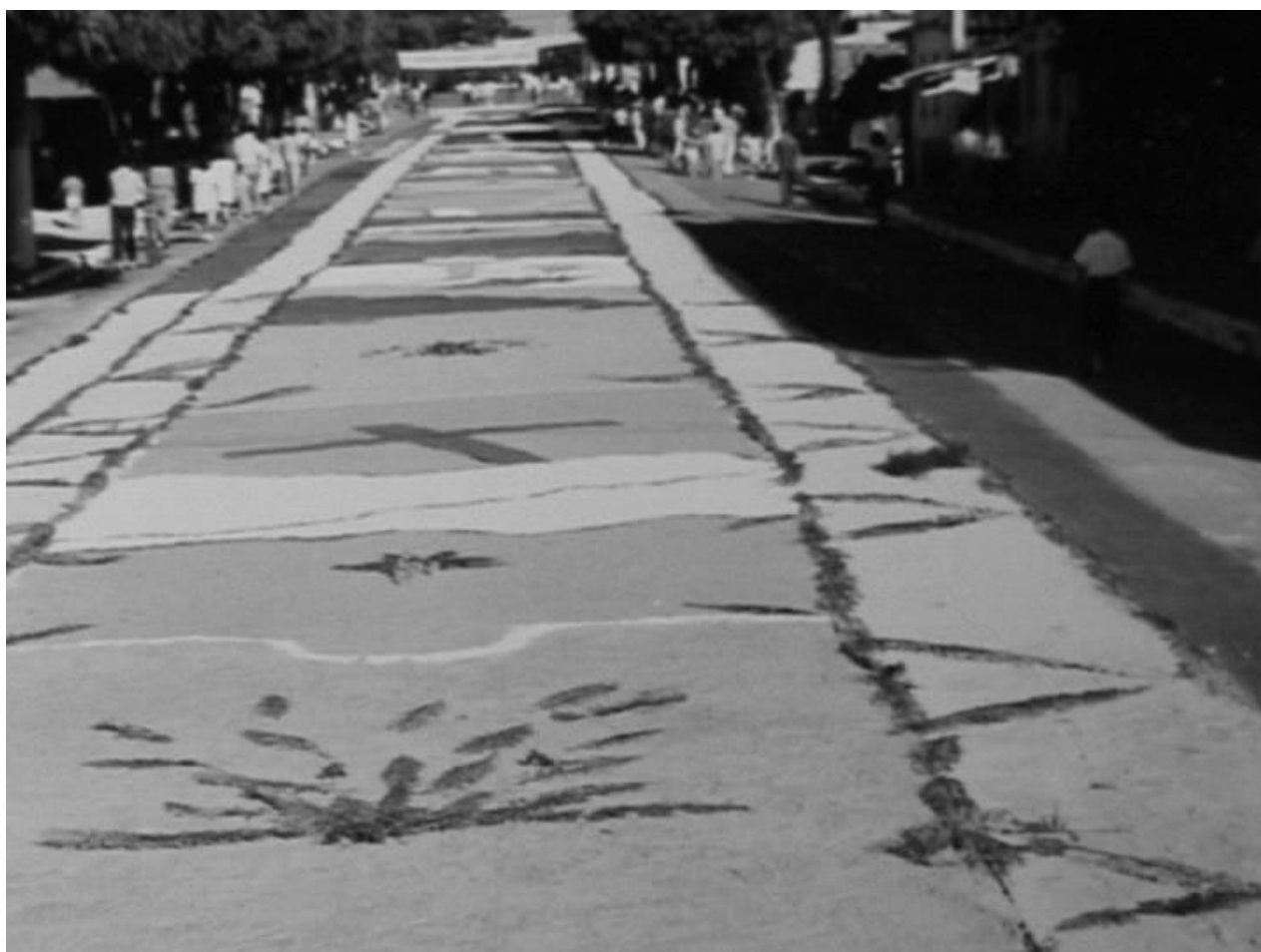
Procissão de Corpus Christi de Capanema-PA na década de 1970.

No final da década de 1970, iniciou-se a tradição dos desenhos religiosos.