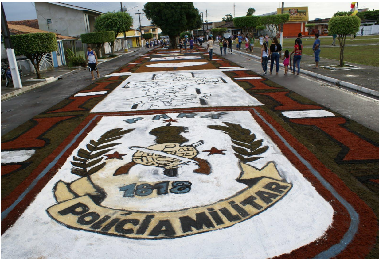
Figura 12 - O símbolo da Polícia Militar surge diante do pedido de paz dos Capanemenses.