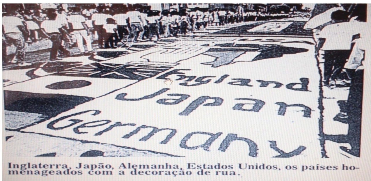
Figura 11 - O Corpus Christi também é um momento de manifestação contra o desmatamento de países estrangeiros.

As representações da colonização indígena no Período Colonial foram observáveis ao longo desses 39 anos de produção de tapetes no Corpus Christi em Capanema-PA. Como exemplo, tem-se a imagem de um padre Jesuíta que desponta pregando a Palavra e segurando um cálice representando o discurso eucarístico e o índio que simboliza a região amazônica e a sua defesa. A matéria veiculada em O Liberal de 26 de maio de 1989 descreve a procissão de Corpus Christi em detalhes, sendo possível, assim, comparar a procissão de hoje com a da década de oitenta do século passado. Quanto ao número de fieis que dela participam, a Paróquia de Capanema-PA calcula que, anualmente, cerca de 30 mil pessoas se fazem presentes no Corpus Christi , número bastante significativo que demonstra que a festa adquiriu amplitude ao longo dos anos, visto que em 1989 o número estimado de participantes era de 5 mil pessoas. Em 1989, outro tapete de cunho profano emerge: