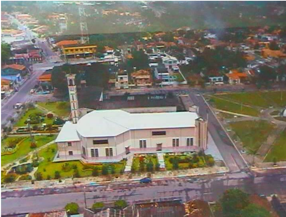
Igreja de Nossa Senhora do Perpétuo Socorro

Em Capanema-PA, é interessante salientar que a devoção ao Sacramento da Eucaristia é um dos fatos mais emblemáticos da paróquia da cidade. Prova disto está na planta da Igreja, que reproduz a forma de um cálice.