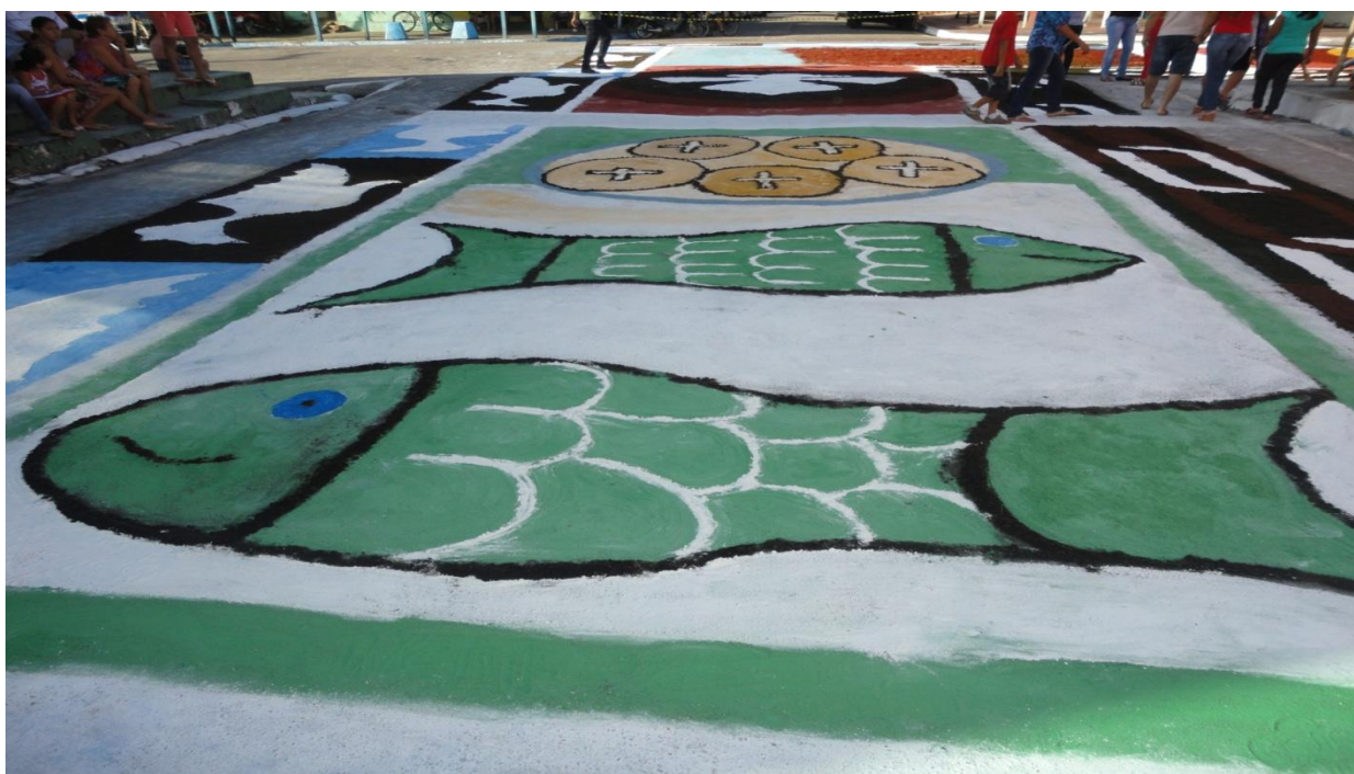
Figura 8 - Foto do Corpus Christi de 2014.

Por estas razões, a simbologia do peixe não poderia deixar de ser acolhida nos tapetes coloridos do Corpus Christi :