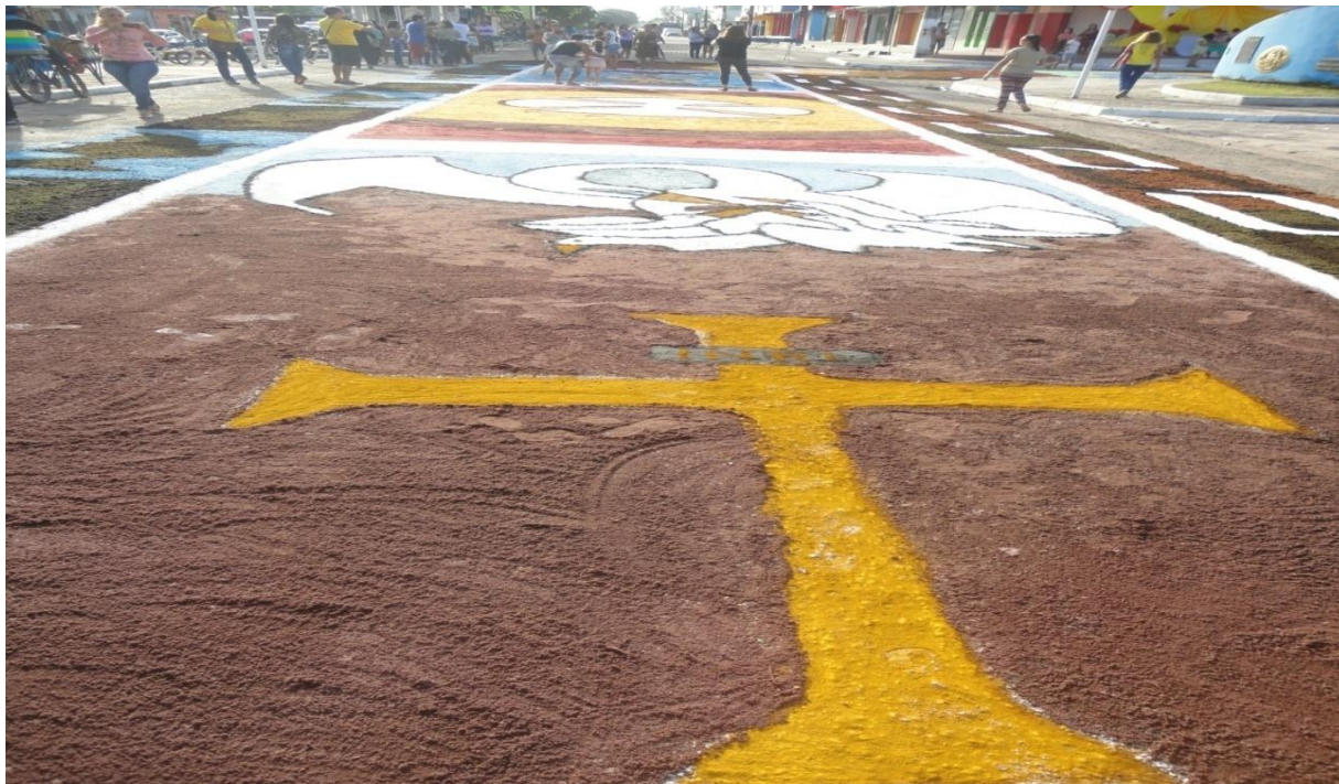
Figura 6 - Cruz de Lorraine, presente na procissão de 2015