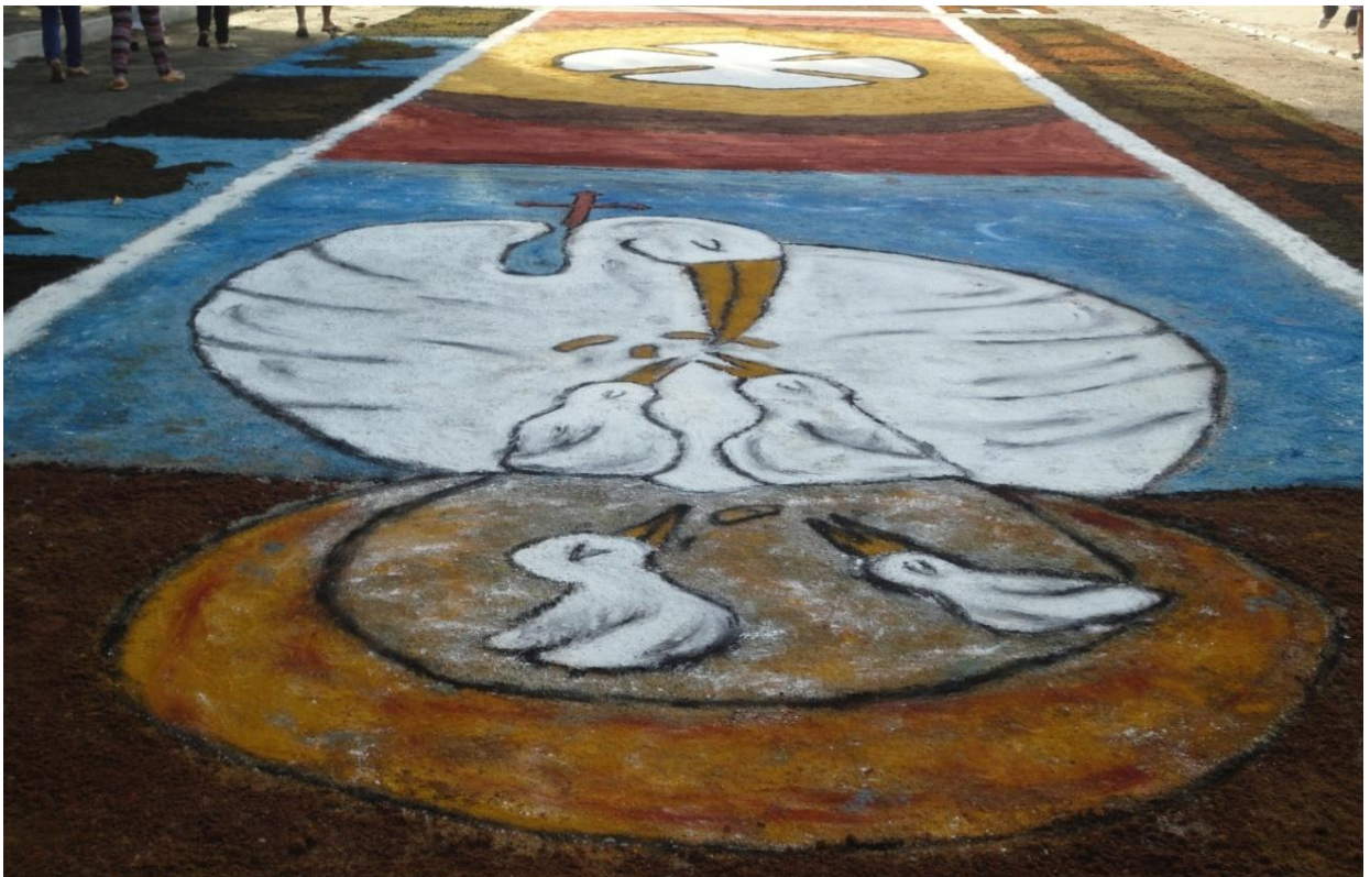
Figura 2 - Pelicano alimenta seus filhotes no Corpus Christi de 2014.

A figura do Pelicano assume, por seu lado, uma dimensão específica no espaço da procissão de Corpus Christi :