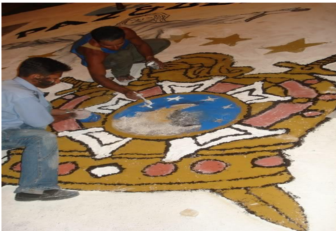
Figura 15 - Jovens desenharam o símbolo Demolay na festa de Corpus Christi .

A participação de membros da Maçonaria no Corpus Christi é uma tradição que perdura há quase 20 anos em Capanema. No ano de 2007, tiveram a oportunidade de criar um tapete com o símbolo da Ordem Demolay (ordem ligada à Maçonaria), confeccionado pelos Irmãos do Capítulo Capanema 158.