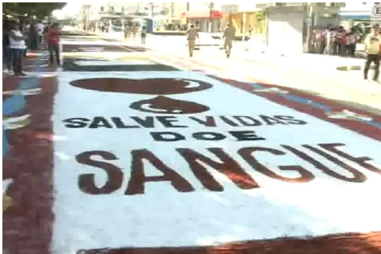
Figura 14 - Em 2012, o Corpus Christi trouxe uma abordagem social.