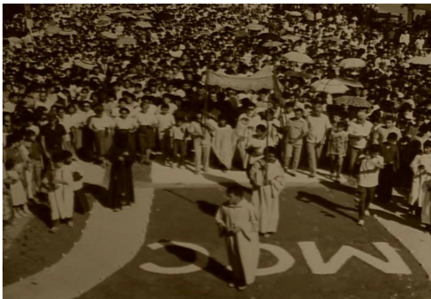
Procissão da década de 1970.