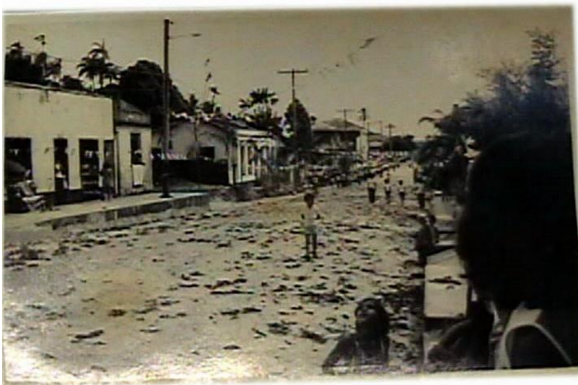
As primeiras manifestações artísticas da procissão no ano de 1976.

A imagem a seguir foi retirada do Documentário de Marcelo Bulhões, Capanemense que organizou a filmagem, em 2006, para comemorar os 30 anos da tradição de ornamentar o Corpus Christi . Na foto pode-se notar as primeiras manifestações da procissão no ano de 1976.