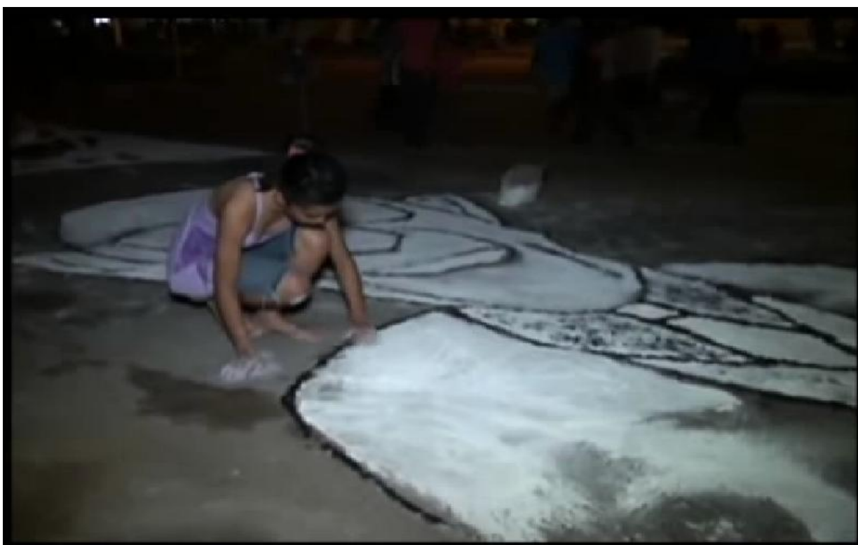
Figura 17 - Jovem prepara o desenho do médium Chico Xavier.

Outro fato intrigante e inusitado que ocorreu na procissão de Corpus Christi em Capanema-PA aconteceu em 2013 com a colaboração de espíritas, ampliando ainda mais a intervenção de temáticas do campo do sincretismo religioso no âmbito da procissão. O curioso é que assim como transcorreu o relacionamento com a Maçonaria, ao longo de sua história, a Igreja Católica mediu forças com o espiritismo e sua ascensão no mundo e no Brasil, visto que tais doutrinas são incompatíveis no que tange, dentre outros aspectos, a crença da reencarnação. Como no caso dos cristãos-maçons, a Igreja também proibiu os católicos de frequentarem cultos espíritas. Entretanto, assim como fez a Maçonaria, o Espiritismo apostou no diálogo com a paróquia de Capanema-PA e, no ano de 2013, um tapete com a imagem de Chico Xavier esteve presente na procissão de Corpus Christi .