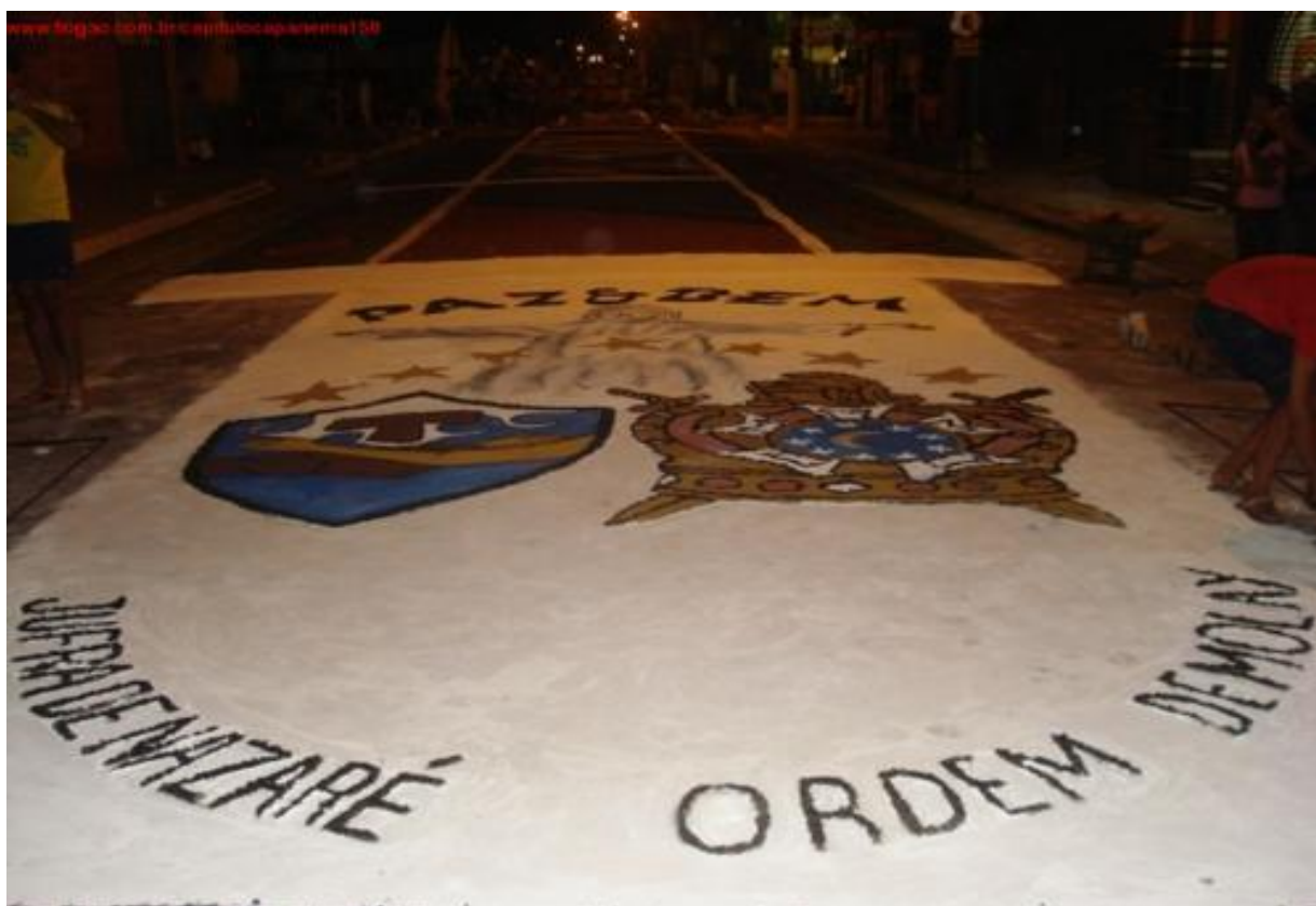
Figura 16 - Em 2007, um símbolo maçom penetra no Corpus Christi capanemense.

Os maçons expõem no site da Associação da Ordem Demolay do Pará que se sentem orgulhosos por terem tido a oportunidade de inserir um tapete com a imagem de um dos símbolos da ordem e acreditam que a confecção do tapete pôde facilitar a quebra de rótulos e preconceitos existentes contra a Maçonaria. Neste tapete, ganha destaque o símbolo da Ordem Demolay que se encontra ladeado, por outro o da JUFRA de Nazaré.