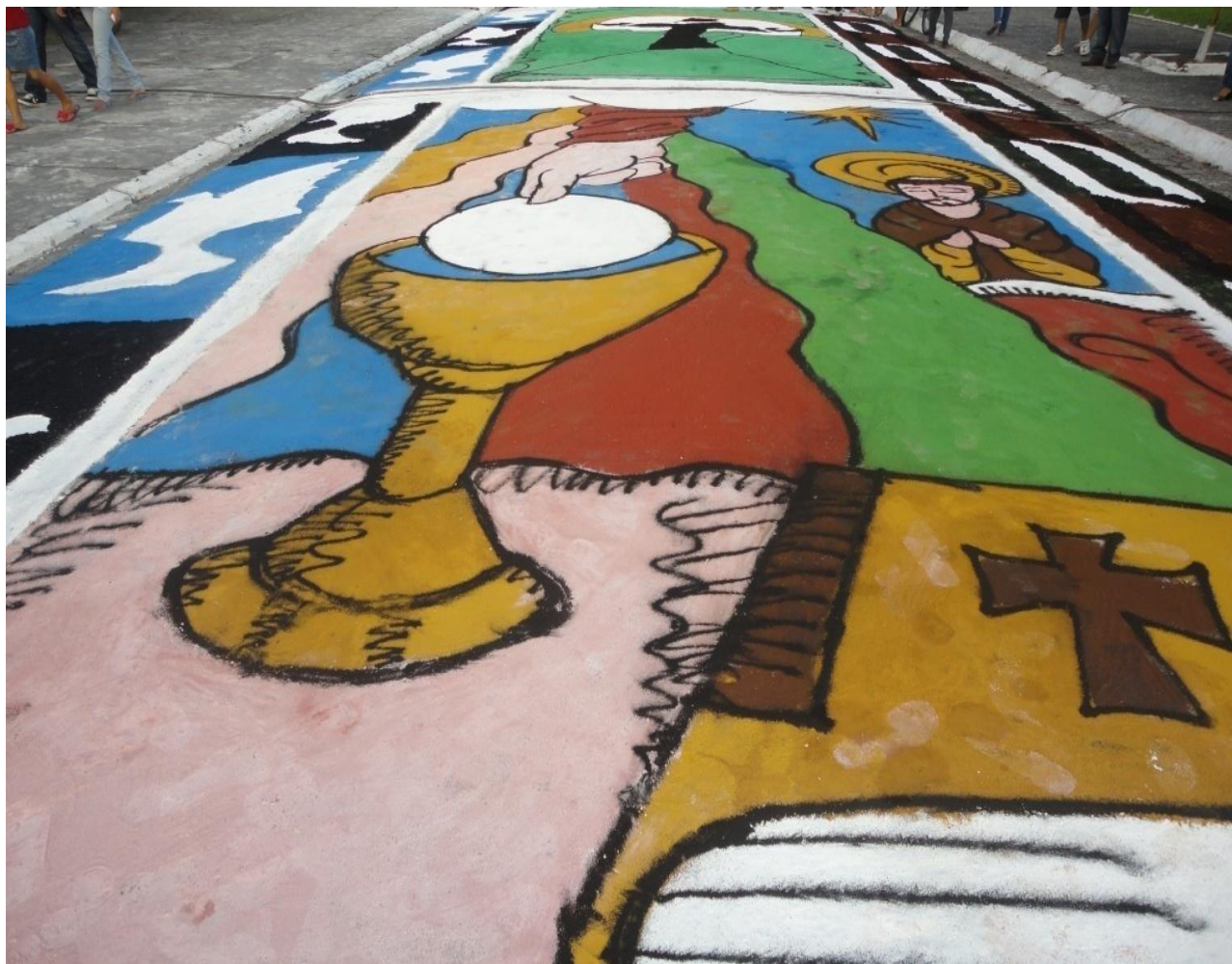
Figura 3 - Ícones presentes na procissão de 2014.