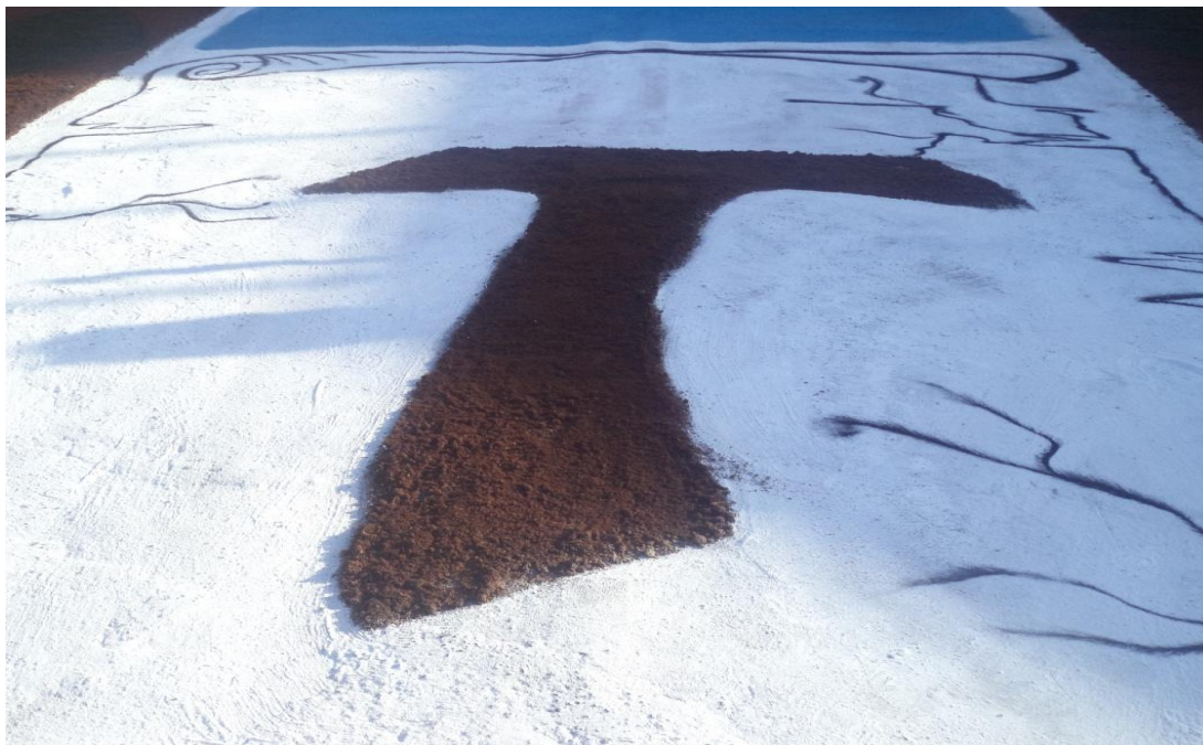
Figura 5 - A Cruz latina é representada no Corpus Christi no ano de 2015.