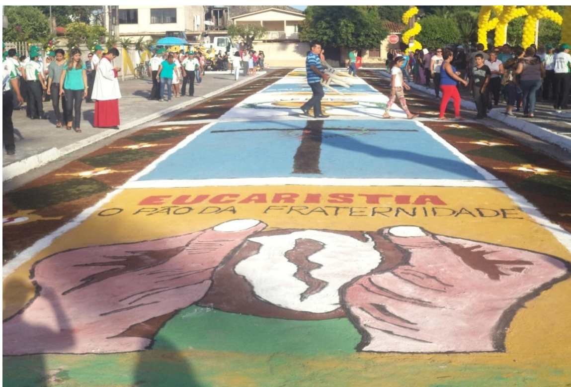
Figura 7 - Pão que, para os católicos, é um alimento também de ordem espiritual.

O pão é assim representado no Corpus Christi de Capanema-PA: