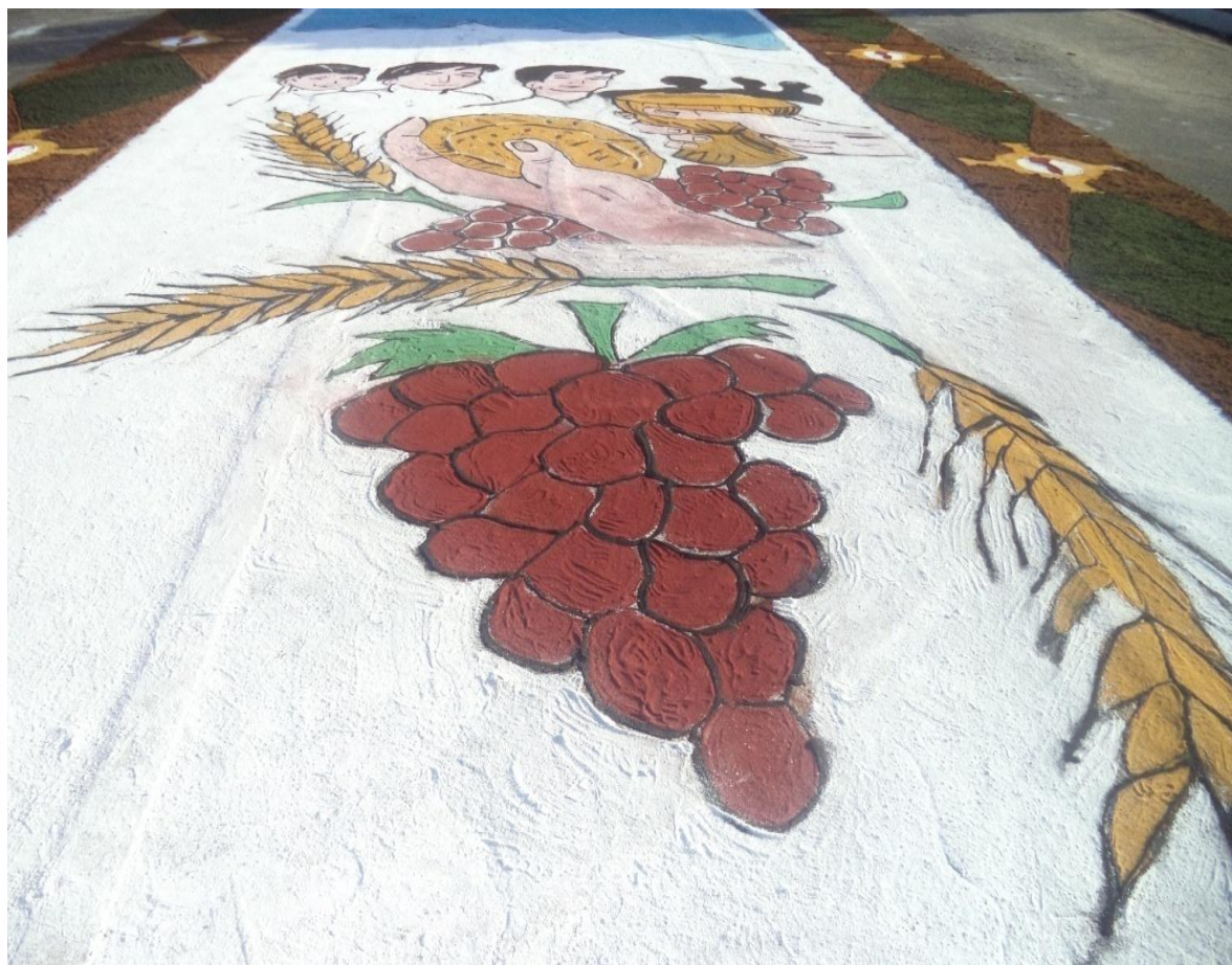
Figura 9 - Uvas desenhadas com cal colorido no Corpus Christi de 2015.

Para finalizar a análise dos símbolos cristãos que anualmente são desenhados e pintados pelos capanemenses não poderíamos deixar de mencionar as uvas.