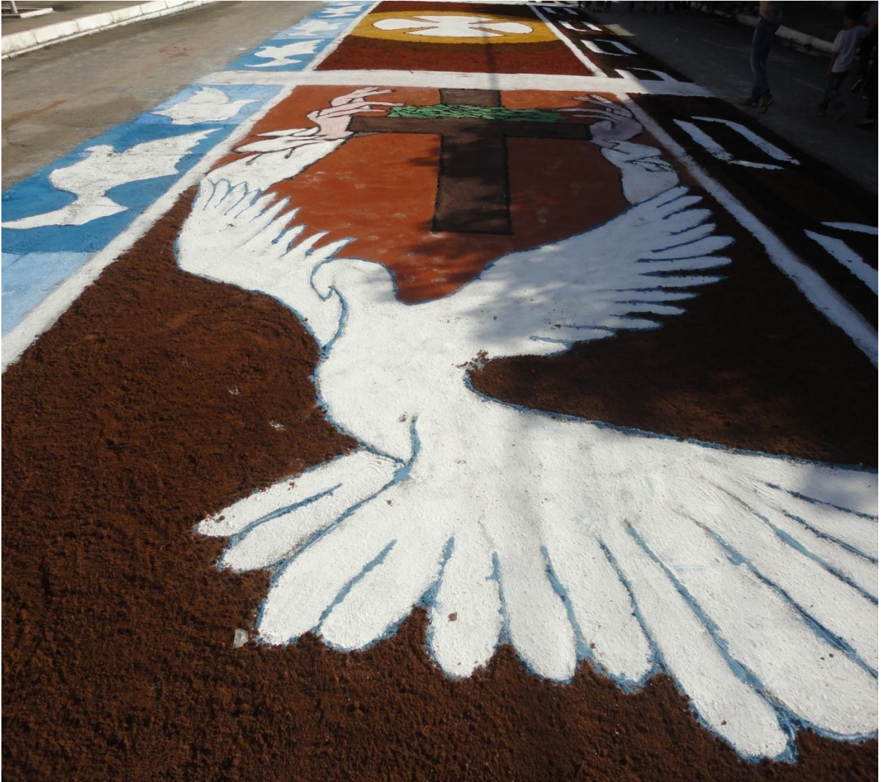
Figura 1 - Tapete do Corpus Christi de 2014. A pomba surge abaixo de uma cruz. Nas bordas, é nítida a sequência de imagens de pombas