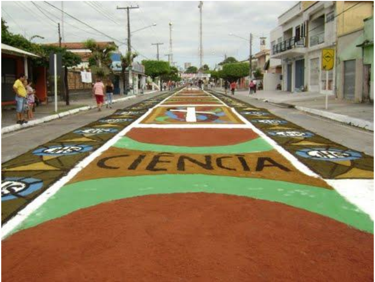
Figura 13 - Em 2010, um tapete que faz menção a ciência se fez presente no Corpus Christi capanemense.

Em 2010, novamente o profano desponta nas imagens dos tapetes da procissão: